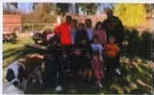
Les enfants de l'Accueil de Loisirs chez Provence Jardin Pépinières